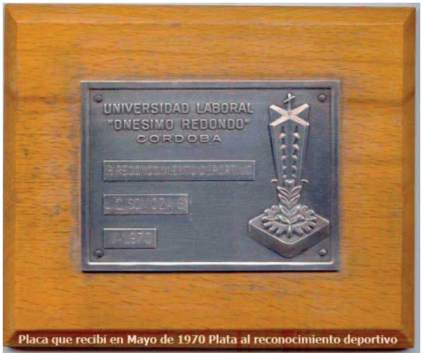
Placa que recibí en Mayo de 1970 Plata al reconocimiento deportivo